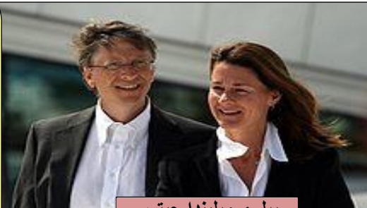
بيل و ميليندا جيتس

" افترضنا أنا و زوجتي ميلندا أنه لو وجدت لقاحات وعلاجات يمكنها إنقاذ أرواح الكثيرين، فإن الحكومات سوف تفعل ما فى وسعها ليحصل عليها من هم فى إحتياج لها ، ولكن هذه اللقاحات لم تكن موجودة. ولم نستطيع الهرب من الإستنتاج المؤلم بأنه - فى عالمنا اليوم - حياة بعض الناس ترى جديرة بالحفاظ عليها فى حين البعض الآخر ليس له أى قيمة ، فقلنا لأنفسنا : "لا يمكن ان يكون هذا حقيقى، وإذا كان، فإنه يستحق أن يكون من أولوياتنا فى العطاء."